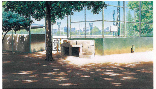
時をかける少女《洗い場》2006年