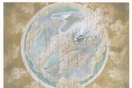
天気の子《氣象神社絵画・天井画》2019年 ©2019「天気の子」製作委員会