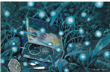
火垂るの墓《捨てられた思い出》1988年 ©野坂昭如/新潮社, 1988