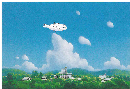
くじらぐも《くじらぐもと散歩》1992年 ©RIEKO NAKAGAWA/Mitsumura Educational Co.,Ltd