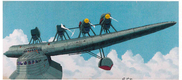
ルパン三世PART2《アルパトロス、翔ぶ》1980年 原作：モンキーパンチ ©TMS