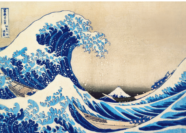
葛飾北斎〈富嶽三十六景 神奈川沖浪裏〉