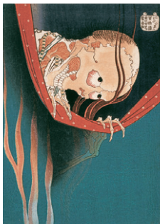
葛飾北斎 〈百物語 こはだ小平二〉