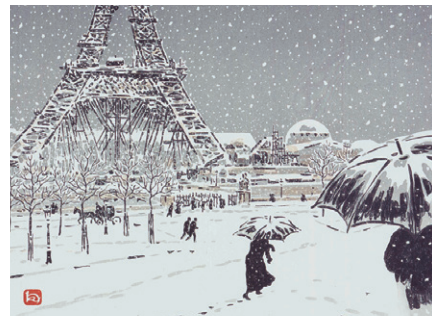
アンリ・リヴィエール 〈エッフェル塔三十六景 建造中のエッフェル塔、トロカデロからの眺め〉