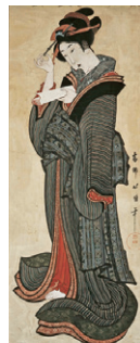
葛飾北斎 〈手紙を読む美人図〉(肉筆画)