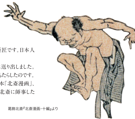
葛飾北斎『北斎漫画・十編』より