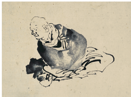
葛飾北斎 〈自画像〉(肉筆画)